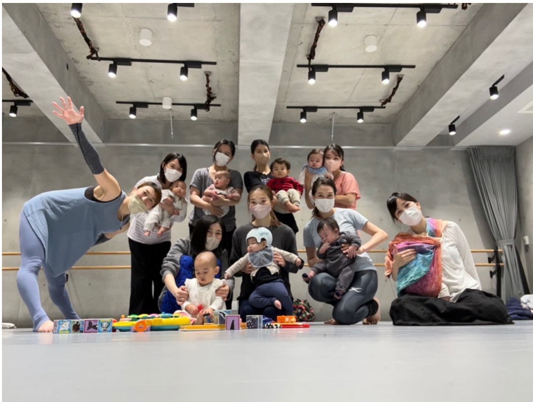
“バレトンfor産後ママ” 月に2回定期開催毎月ほぼ満員御礼でした♪

ママと赤ちゃんが気軽に集い交流したり、産後のカラダをケアしたり、赤ちゃん通しも異年齢の中で運動したり遊べる場を作りママと赤ちゃんの憩いの場となりました。