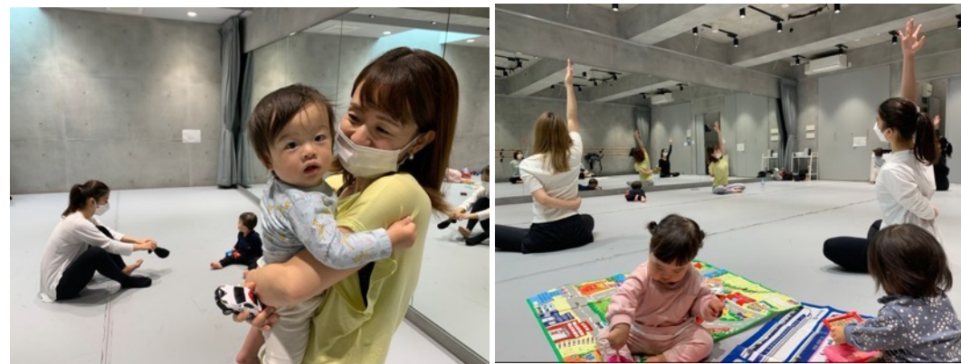
↑赤ちゃんをスタッフが見守りながらママたちは安心してレッスン中