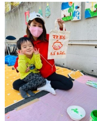
↓ママと赤ちゃんがステージ出演したイベント