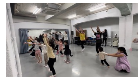
↓ハロウインのレッスン時の様子。ママやパパも本気の仮装をしてみんなで同じ振り付けのダンスを楽しみました♪