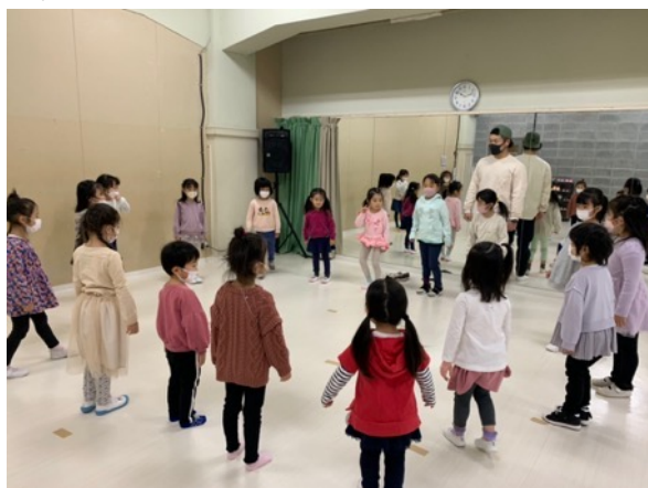
↓ダンスワークショップでのレッスン