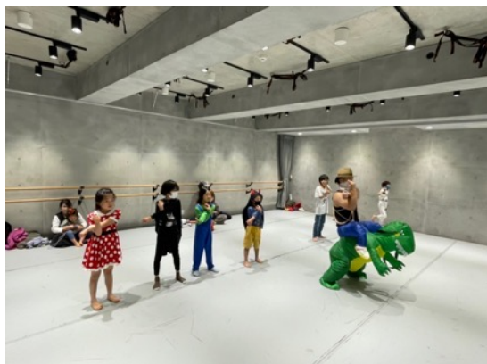
↓ダンス発表会の風景

大好評のキッズダンスのクラスでは季節に応じたイベントやダンス発表会を行いました。 ママやパパも一緒に子供たちとダンスをしたり、ハロウインの仮装をしたり家族みんなでダンスの時間を楽しみました♪