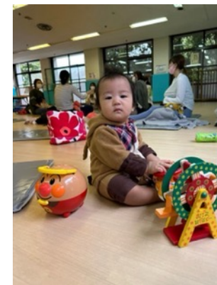
↑開催無料の子育て広場の様子。 ママ達のカラダの不調を直接伺いながらレッスンをしました。