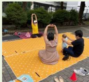
渋谷どこでも運動プロジェクト × ママぷら Kids&Baby