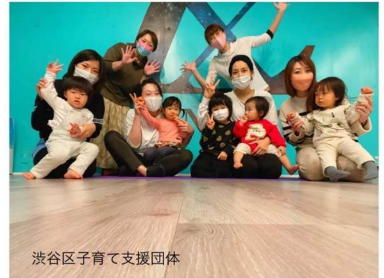
渋谷区子育て支援団体