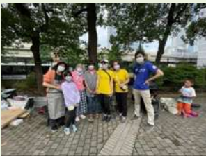
ありがとうございました🙏😊