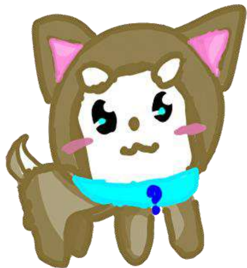
ササハタハツまち遺産探検隊 公式キャラクター たん犬くん